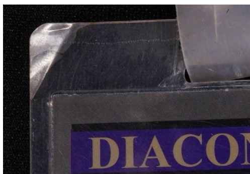
Descolamento da plastificação